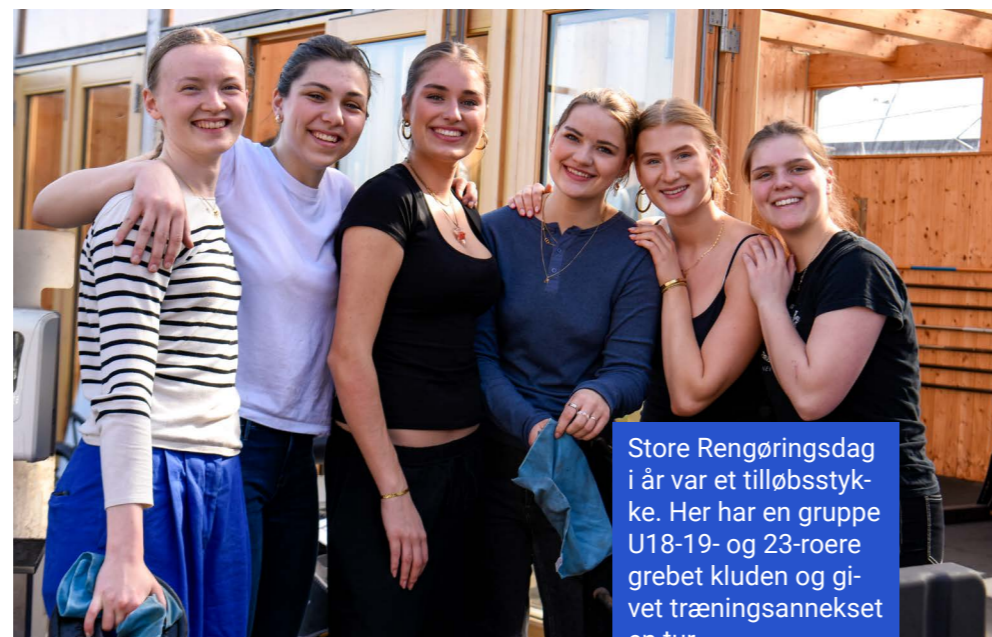
Store Rengøringsdag i år var et tilløbsstykke. Her har en gruppe U18-19- og 23-roere grebet kluden og givet træningsannekset en tur.

M ad: Du kan købe et dejligt måltid mad i klubbens restaurant hverdagsaftener efter træning.