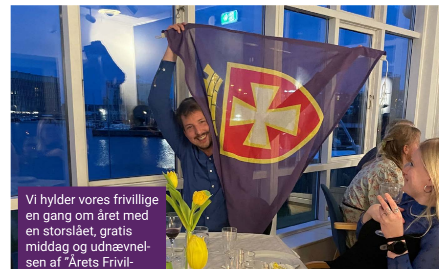
Vi hylder vores frivillige en gang om året med en storslået, gratis middag og udnævnelsen af "Årets Frivillige", der får en stor DSR-stander.

W orld Rowing er den internationale organisation for rosport. Se mere om World Rowing på worldrowing.com