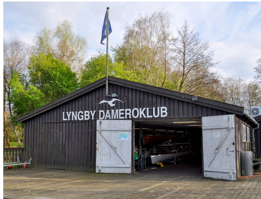
Af Antonie Lauritzen

Det står særdeles fint til i Lyngby Dameroklub.