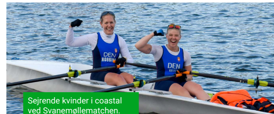
Sejrende kvinder i coastal ved Svanemøllematchen.

O rienteringsløb: Klubben har en orienteringssektion, der arrangerer hyppige løb i Ravnsholt Skov fra Gåsehuset.