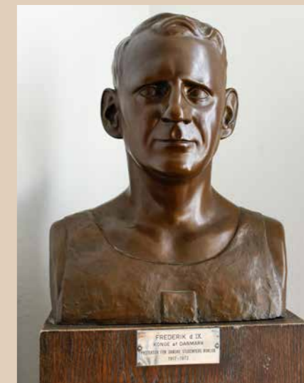
Buste af Kong Frederik IX i klubben. Han var protektor for DSR i mange år og medlem af klubben, hvor han deltog i klubblivet med de andre roere fra Københavns bedre borger-skab. Under krigen forsøgte modstandsfolkene at få ham med i kampen, men det måtte han afslå. Han er afbilledet i træningstrøje.