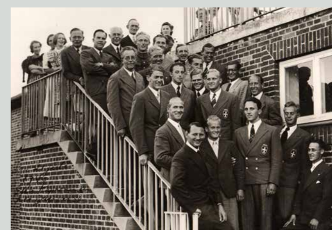
Forside: En fin forsamling af DSR's medlemmer efter en kaproning på Bagsværd Sø i 1940. Kronprins Frederik deltog og ses nederst i billedet ved gelænderet. Se også midtersiderne.