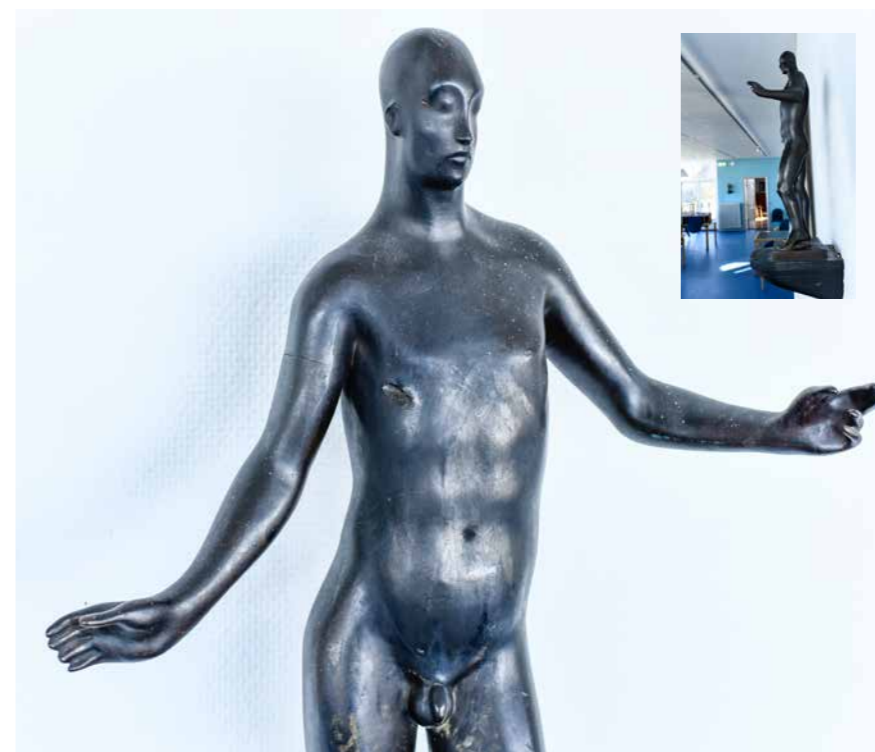
Jean Gauguins (søn af den berømte..) statuette på klubbens terrasse rammes af skud fra et tysk minefartøj på vej ud af havnen på befrielsesmorgen. Denne "dårlig taber" attitude, kostede et skudhul i statuettens højre bryst, som stadig er synligt. Der er fomentlig også røget et par ruder.

i klubben i krigens år nævnes navnene på medlemmer, som er afgået ved døden siden sidste generalforsamling, herunder nogle af de 19, men intet om årsagen.