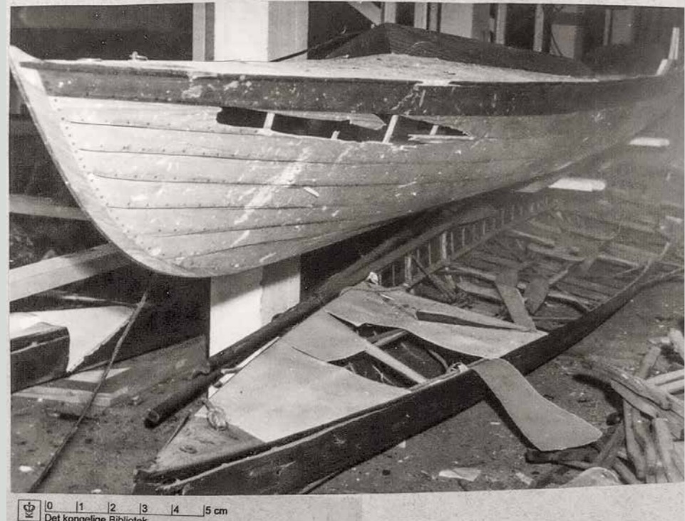
Klubben blev i januar 1944 udsat for "Schalburgtage", som var det folkelige navn for den terror, som tyskerne og deres danske hjælpere i Schalburgkorpset indledte i den sidste del af besættelsen i Danmark. Schalburgkorpsets terror var rettet mod den danske modstandsbevægelse. Det gik ud over DSR's bådhus, som korpset betegnede som en "modstandsrede". Den betegnelse kan vi jo kun være stolte af nu. (Kilde: Det Kongelige Bibliotek)