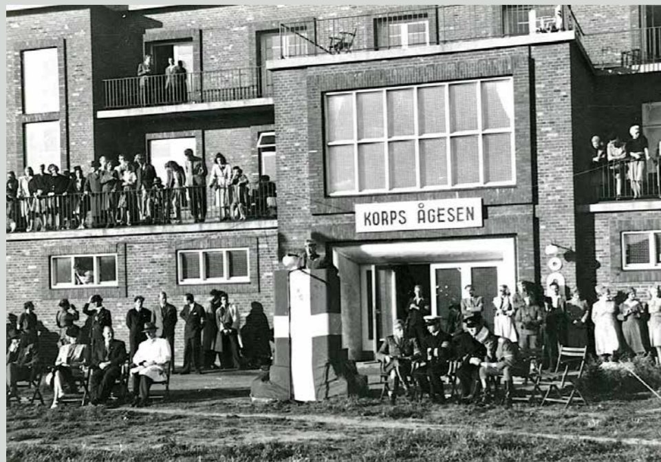
Den militære afdeling af modstandsbevægelsen Korps Ågesen festede igennem i månederne efter befrielsen den 4. maj 1945. DSR lagde hus til den festivitas, hvilket ifølge anekdoterne godt kunne ses bagefter!