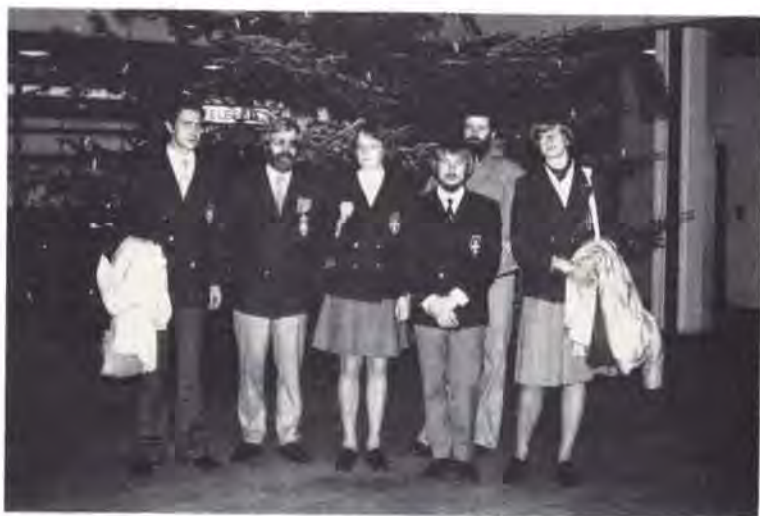
2 hold forsøgte at gentage turen i julen 77/78.

morgen, men lige så naturligt bestiller man da ikke transport før man har set at holdet er ankommet.