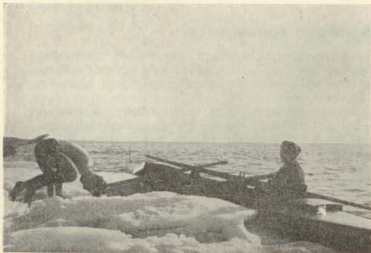
til klubben åbner igen!