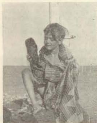
han har altid været en kæk dreng.

— Rent klubmæssigt set, ja. Når man er sluppet ud af instruktørens beskyttende favn og skal til at klare roningen på egen hånd og se at blive opsuget af klublivet, så står man unægtelig og småfryser på forpladsen, i en kold verden, hvor det blæser ind fra molerne.