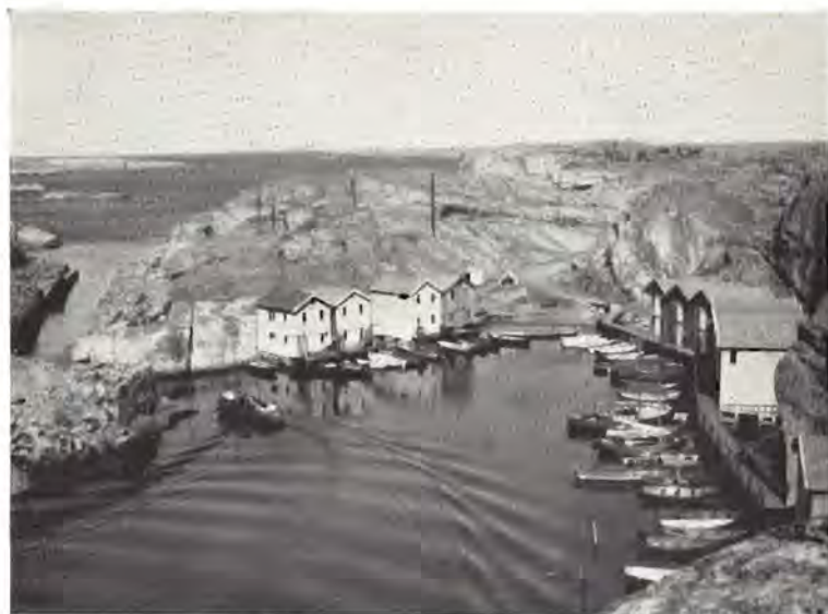
Karakteristisk parti fra Smögen.