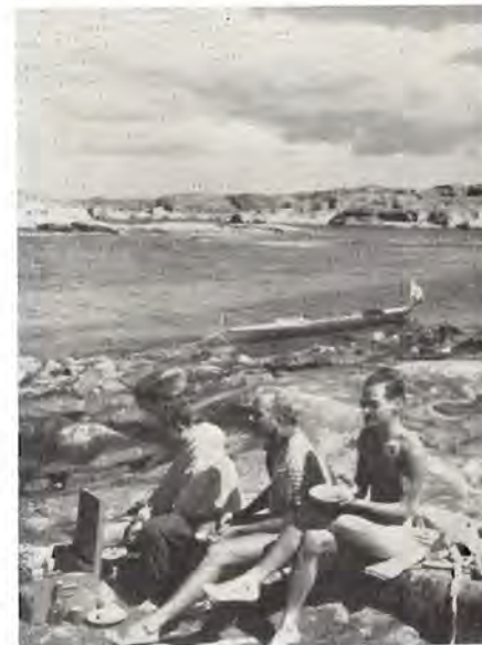
Indhug i proviantkassen.