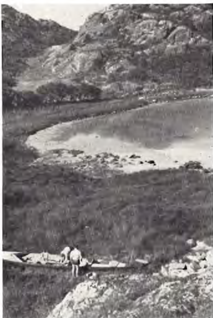
Båden gøres klar til næste etape.