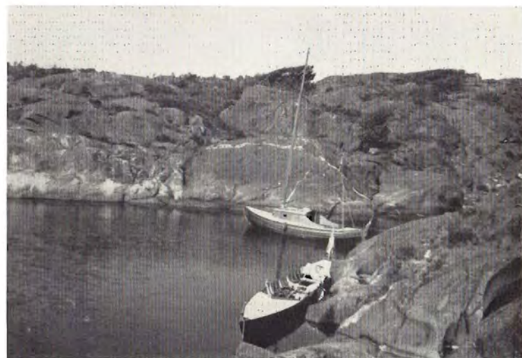
...når man ind i den lune havn.