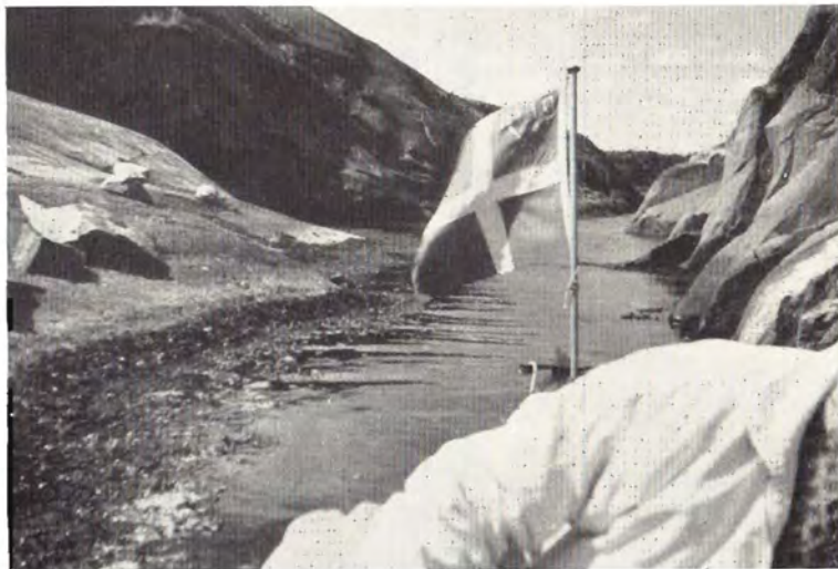
Ad denne snævre passage...