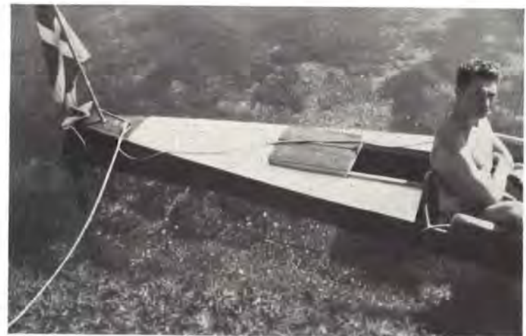
Vandet er ofte ganske krystalklart i skærgården.

En ny og virkelig god idé var de ture, som rocheferne arrangerede under navnet: »omelet surprise«, en tur ud i det blå, som navnet antyder. Der var et par stykker af den slags, og især havde omelet nr. 2 en overvældende tilslutning. Deltagerne, der ikke i forvejen kendte turens