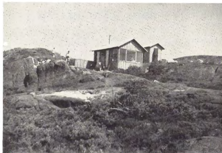
Øverst oppe ligger hytten og dens anneks,