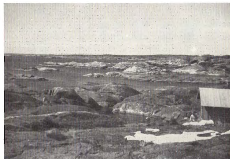
hvorfra vi nyder den pragtfulde udsigt over skærgården og Skagerak.