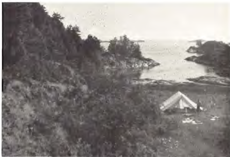
St. Fluor, øst for Kragerö. (Fortrinlig teltplads.)