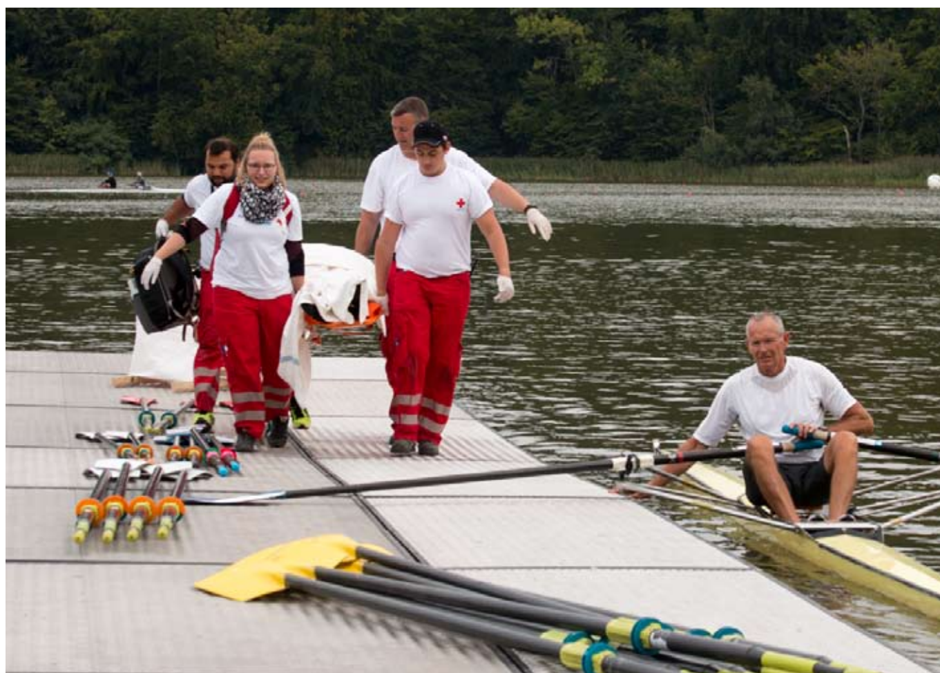
Redningsøvelse på Bagsværd Sø forud for World Rowing Masters Regatta 2016