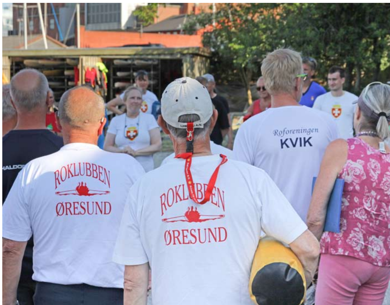
De kom fra nær og fjern