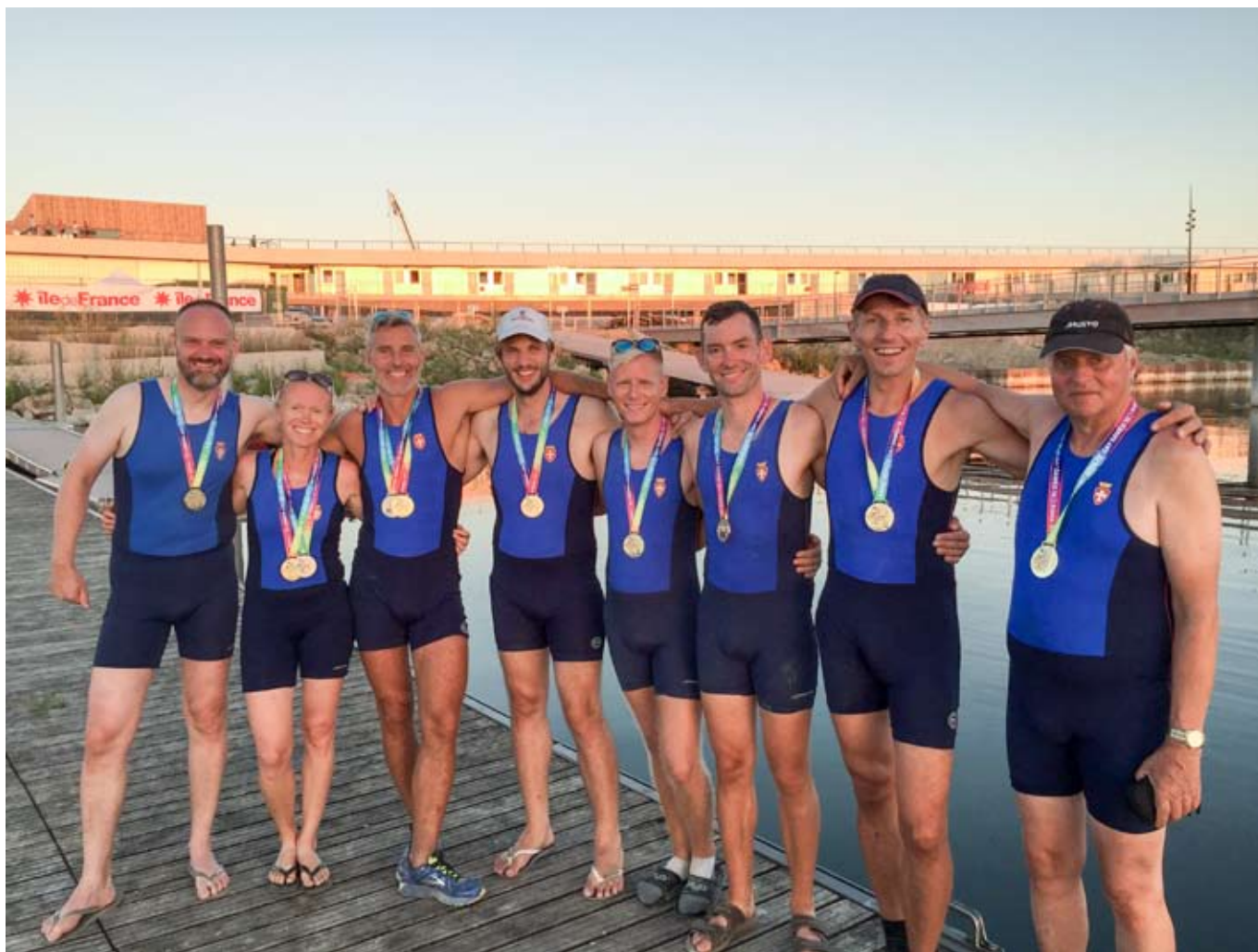
DSR's hold til Gaygames Paris 2018